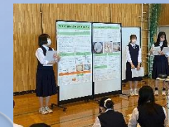
英語によるプレゼンテーション