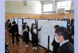
ポスターセッション