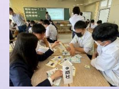
カーボンニュートラルゲーム