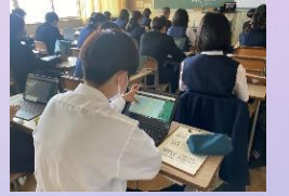
データサイエンス学習