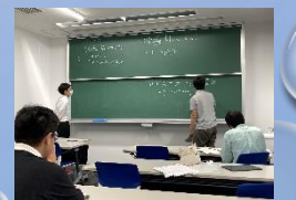
大学での共同研究