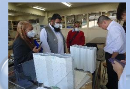
JICAの研修生との交流